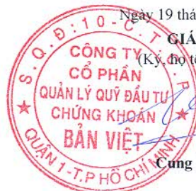
Cung Trần Việt

Ghi chú: Những chỉ tiêu không có số liệu có thể không phải trình bày nhưng không được đánh lại "Mã số".